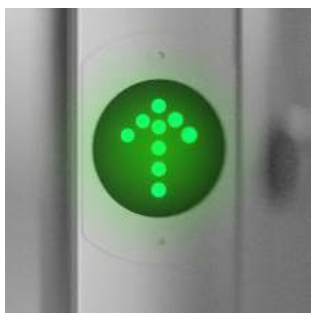
Ljussignalering med piktogram