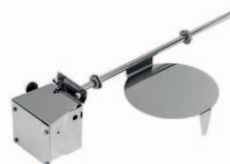
Skyddslock över kvarn- inlopp i disklåda/diskbana