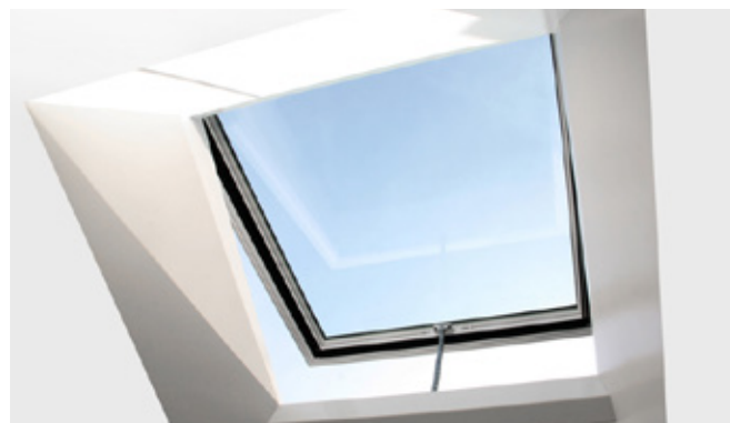
Öppningsbar med dold kedjemotor.