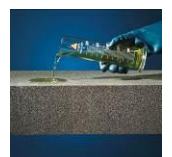
Syra- och kemikaliebeständigt