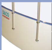
Isolering och baksides- beklädnad

Isolering+baksidesbeklädnad ger lägre ljudnivå samt energibesparing Isdamm