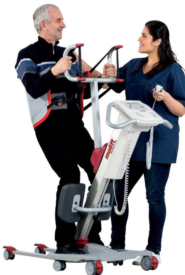
Fyrpunktsbygel och Lyftsele RgoSling Active

Lätt att manövrera vid förflyttning tack vare lyftens sex hjul. Enkel att hantera vid toalett, uppresning och ståträning.